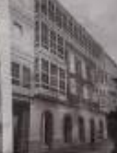
Rehabilitación. La fundación prevé concluir a finales del 2025 la rehabilitación del edificio que albergará su museo y sus actividades, con destino al mercado de alquiler para acogida al refugio Pardo de Abán.