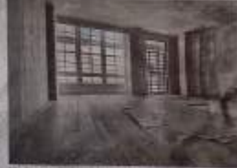
Madera de roble en las galerías y suelos de gres porcelánico. El nuevo techo de madera que se instalará en el edificio que albergará el museo y las actividades de la fundación.