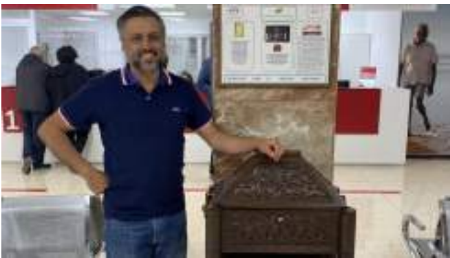
La arqueta ya está instalada en el recibidor del hospital de Caranza