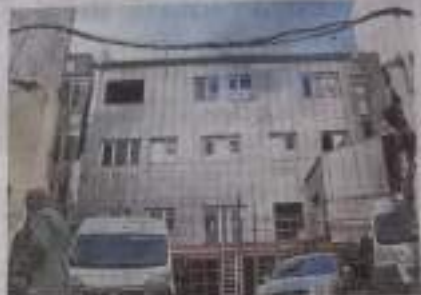
Plano de obra. La Agrupación de Obras de Urbanización de Ferrol ha aprobado el proyecto de rehabilitación del edificio que albergará el museo y las actividades de la fundación. El proyecto de obra prevé la rehabilitación del edificio que albergará el museo y las actividades de la fundación. El proyecto de obra prevé la rehabilitación del edificio que albergará el museo y las actividades de la fundación.

La fundación prevé concluir a finales del 2025 la rehabilitación del edificio que albergará su museo y sus actividades, con destino al mercado de alquiler para acogida al refugio Pardo de Abán.